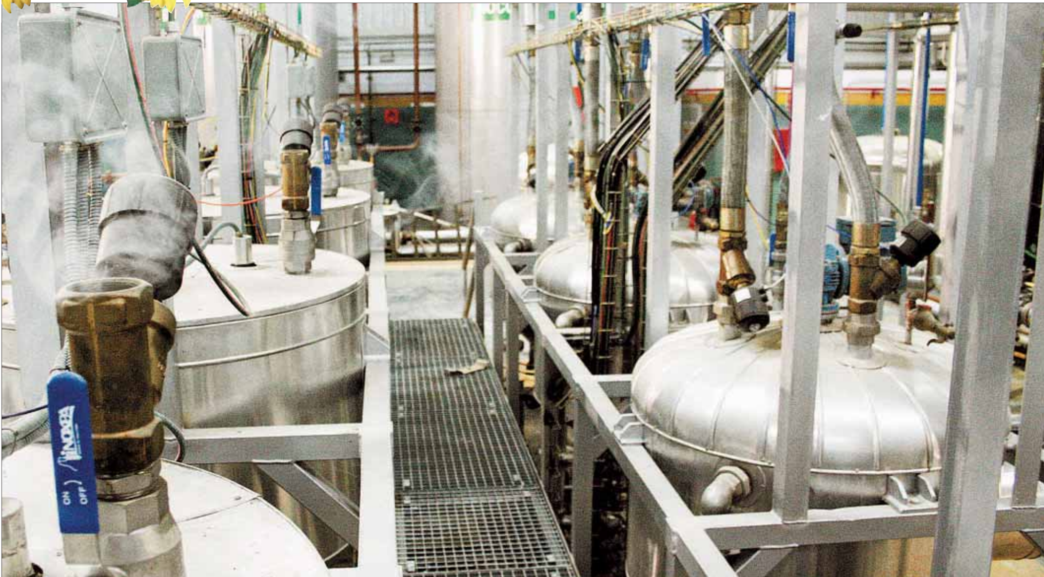
La planta castreña ocupa una nave de 1.200 metros cuadrados en la que se ha trabajado desde el año 2005.

Puede usarse como carburante, puro o mezclado con gasóleo, en todo tipo de vehículos que funcionen con este combustible.