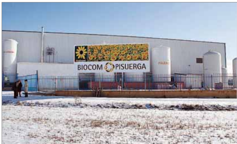
Tanques de almacenaje de la factoría castrejana.

mentar la plantilla y los turnos en función de la demanda, llegando a los 12 empleos y a una actividad productiva de 24 horas.