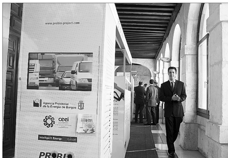
La muestra permanecerá instalada en el Hospitalillo hasta el día 15.