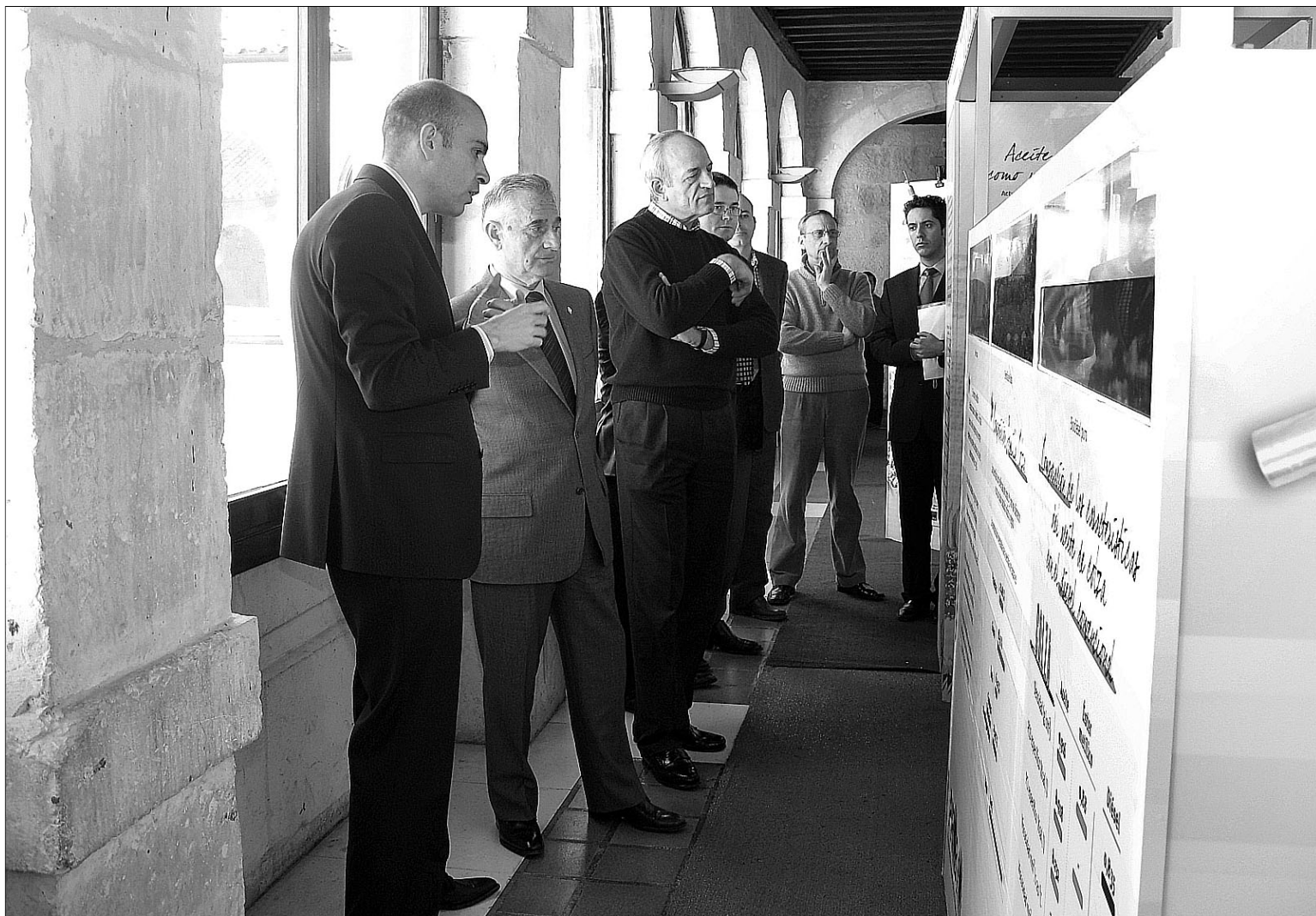
El presidente de la Diputación asistió al acto inaugural de la exposición itinerante que arrancó ayer en Briviesca.